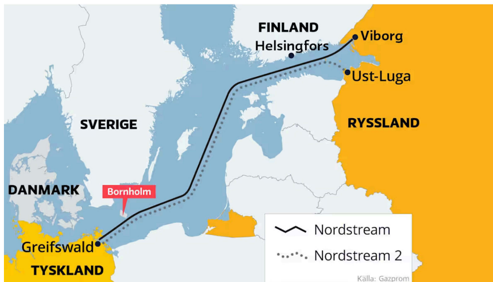
Gasledningarna Nord Stream 1 och 2 passerar den danska ön Bornholm.

Som jämförelservisas nedan en kartbild av sträckningen för gasledningarna Nord Stream 1 och 2 genom Östersjön, de passerar Gotland längre österut än det nu aktuella undersökningsområdet.